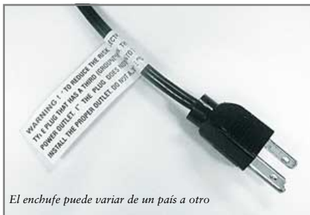
El enchufe puede variar de un país a otro

Tamaño máximo de habitación: 300 pies cuadrados (27.9 m 2 )